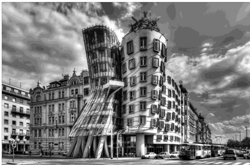
Прага. Шоковая реплика современной архитектуры в классическом городе

трактовали как «окаменевшую метафору», то сейчас наблюдается переход к метафоре палимсеста, согласно которой основное внимание теперь сосредоточено на том, что архитектурные формы делают , а не что они представляют . Речь, по-видимому, идет о том, что в понятии архитектуры как «окаменевшей метафоры» как бы замораживаются прошлые смыслы, а палимсест будто бы преодолевает статичность архитектурной формы и придает ей динамику преобразования, связанного с новыми смысловыми контекстами, что включает человека в актуальное взаимодействие с архитектурной формой. Но принцип палимсеста сам по себе нельзя трактовать как безусловно положительный фактор оживления реакции воспринимающего на изменения в современной городской среде.