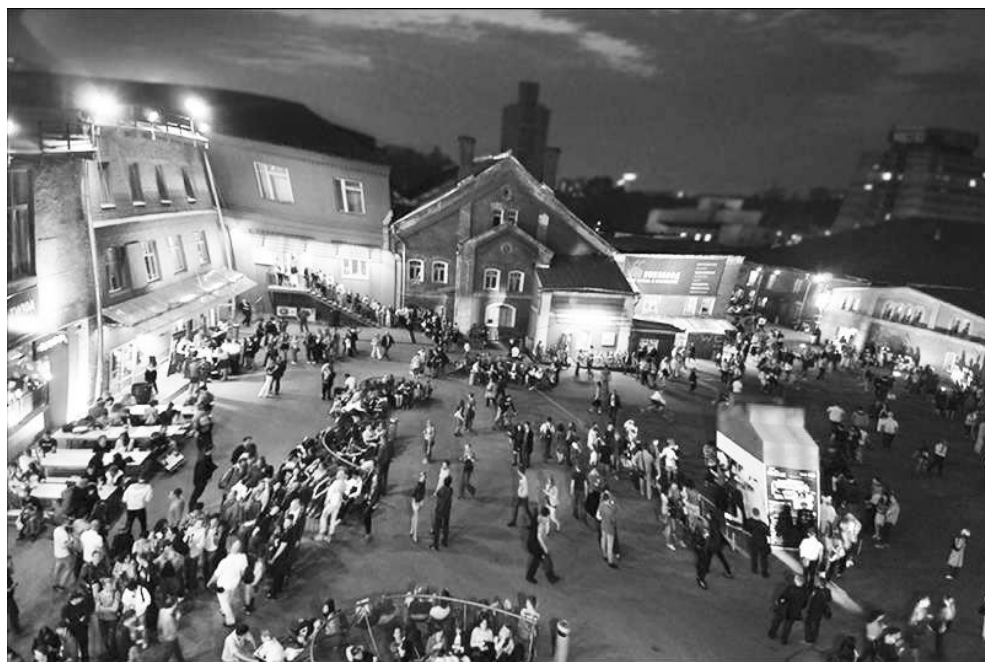
Москва Реновация Винзавода в современное Артпространство

Вместе с тем сегодня актуальным направлением в трансформации сложившейся городской среды является и часто весьма успешное преобразование некоторых прошлых архитектурных сооружений (заводов, фабрик, даже тюрем), утративших свои прежние функции, в новые объекты, получающие современное назначение. Такое обновление может способствовать преодолению депрессивности восприятия старых объектов и их включению в новый жизненный цикл, связанный с новыми возможностями антропологической вовлеченности. (Рис. 3, 4)