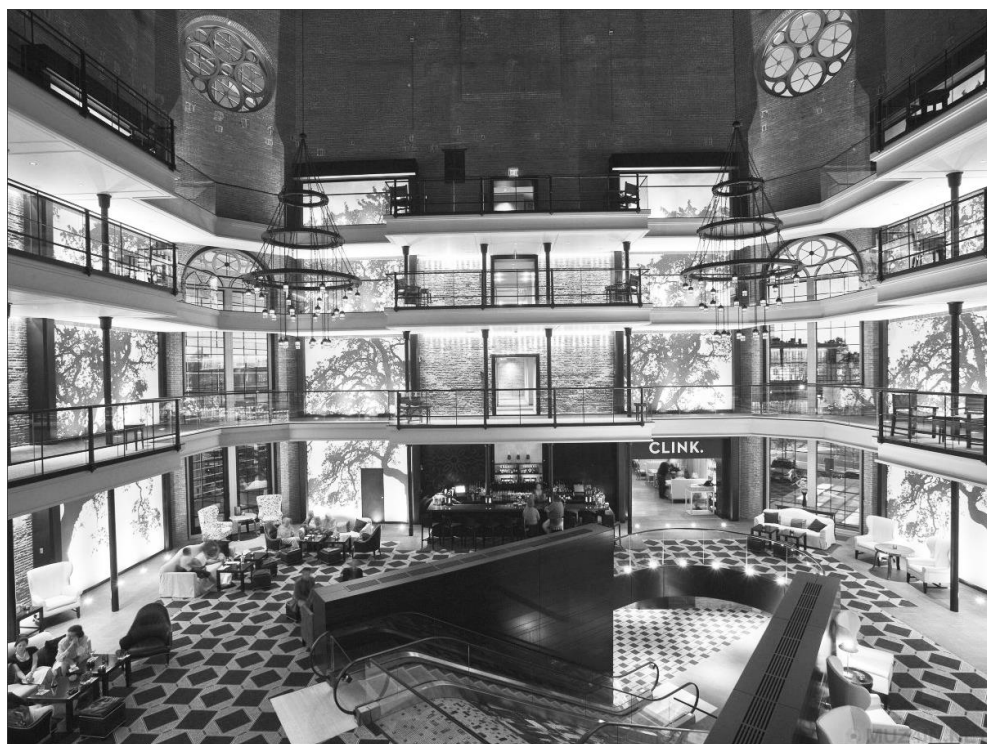
Преобразование интерьера тюрьмы в современный отель. Австрия

Таким образом, если и можно признать в целом позитивное значение так называемого антропологического поворота в современной урбанистике, сам по себе этот факт еще не является панацеей от негативных черт надчеловечного мегаполиса. Все дело в том, как трактуется само антропологическое содержание. Так, например, немало угроз человеку несет в себе тенденция формирования глобализованного пространства, реализуемая при создании различных многофункциональных офисов, построенных по принципу механистического понимания человеческого тела с точки зрения универсальной эффективности и комфорта. Здания внешне устойчивые как бы «разжижаются» динамикой коммуникативных компьютерных операций и становятся дестабилизированными и неоднозначными. Вследствие взаимодействия разнообразных материальных и нематериальных, человеческих и нечеловеческих сущностей возникает новая среда космополитичных сенсорных миров, а