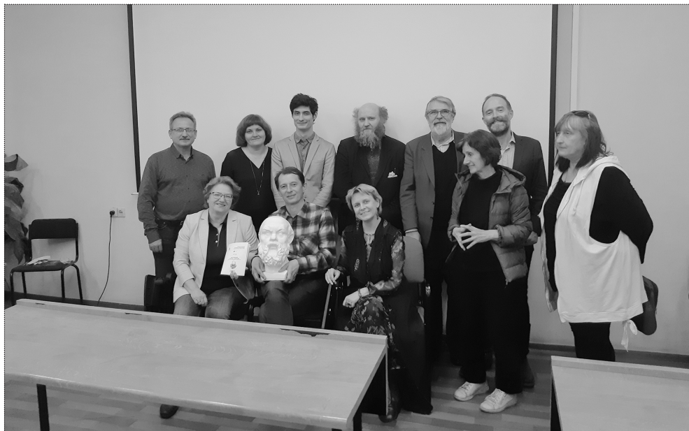
Илл. 6. Групповой итоговый снимок участников заседания антропологического семинара «Боги, люди и миры в прошлом и настоящем» — XII.